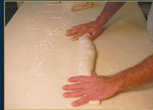
Handgerollte Baguettes baguettes rolled by hand