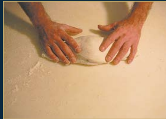
Schonende Aufarbeitung careful handling