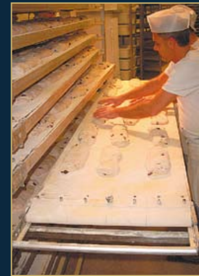
Sorgfältiges Absetzen diligent handling