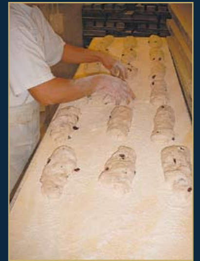
Optische Endkontrolle final visual inspection

„Es gibt keine kreative Arbeit ohne Tradition. Jede Neuheit ist immer eine Variation des Vergangenen.“ (Carlos Fuentes)